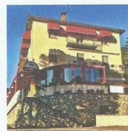
ALBERGO STAFFORA CASANOVA DESTRA