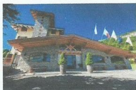
SPORT HOTEL PRODONGO BRALLO

Per info telefonare ai numeri 3389874453 (Gianni) o 3334083922 (Luisa)